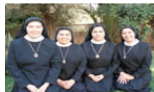
Educación y formación cristiana