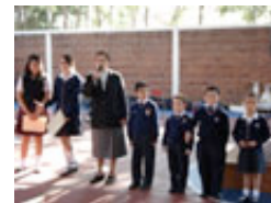
formación cristiana de niñas huérfanas y abandonadas